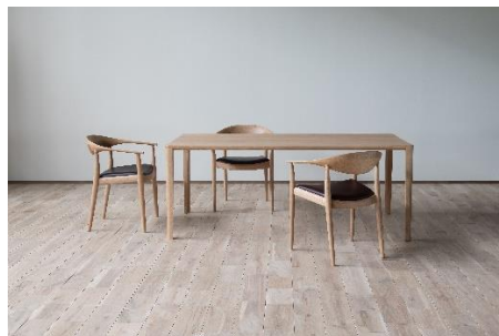
◎匠工芸 CRAFT チェア ※初出展