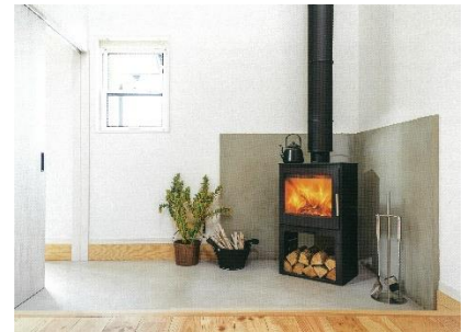
◎コンベックス 薪ストーブ